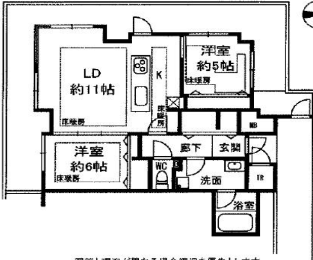
図面と現況が異なる場合現況を優先とします