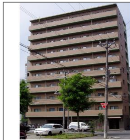
REAL NET PRO POWERED BY JAPAN BOOKS CO.,LTD.